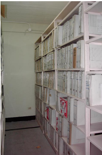
Les revues et archives